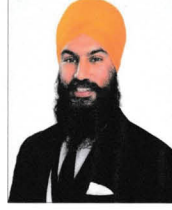
Jagmeet Singh NDP+NPD

सहयात्रा क्यानडा ले आयोजना गरेको ५६औं र ५७औं अन्तर्राष्ट्रिय जातीय एवं रंगभेद विरुद्धको दिवस (International Day for the Elimination of Racial Discrimination) २१ मार्चको अवसरमा New Democratic Party, Canada का प्रमुख तथा माननीय सांसद जगमित सिंहले शुभकामना दिनुका साथै नेपाल लगायत दक्षिण एसियामा रहेको जातीय विभेद विरुद्धको सवालमा आफू र आफ्नो दलको ऐक्यबद्धता रहेको एक भिडियो सन्देश र तथा लिखित सन्देश दिनुभएको थियो । सहयात्राले क्यानडाबाट राजनीतिक रूपमा जातीय विभेद विरुद्धको सवाल उठान गरिएकोमा माननीय सांसद सिंह तथा उहाँको राजनीतिक दललाई धन्यवाद व्यक्त गर्नुभएको थियो ।