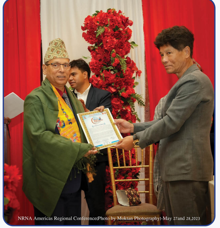
NRNA Americas Regional Conference - May 27 and 28, 2023